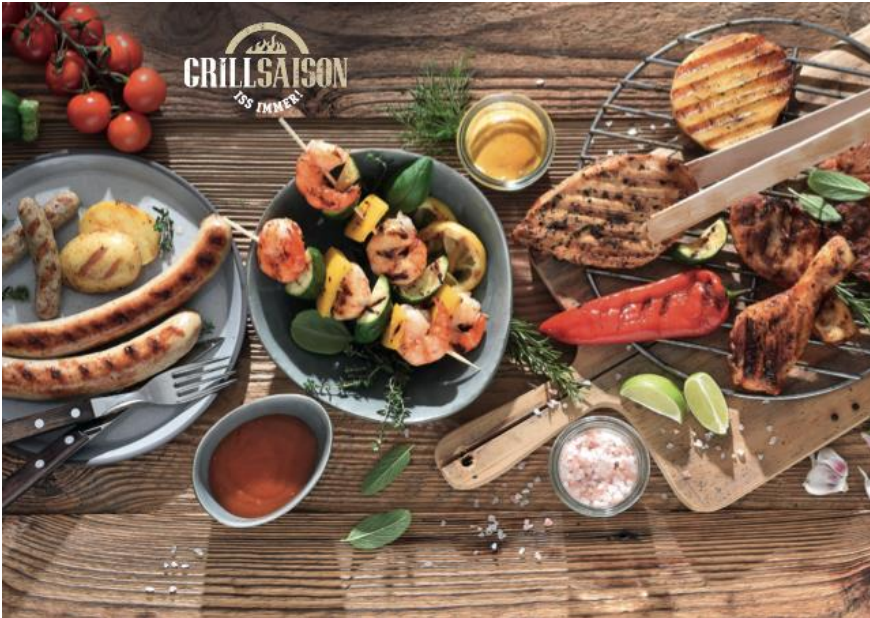
NETTOs Eigenmarke "Grillsaison – Iss immer"

Stavenhagen, 24.04.2017. Während die einen den Grill erst bei wärmenden Sonnenstrahlen anfeuern, ist Grillen für die anderen ein Ganzjahres-Vergnügen. Mit seiner Eigenmarke „Grillsaison – Iss immer“ reagiert der regionale Lebensmitteldiscounter NETTO, Tochter des dänischen Konzerns Dansk Supermarked, nun auf diesen Trend und sorgt für noch mehr Abwechslung auf dem Rost. NETTO-Kunden finden unter der Eigenmarke verschiedene Grillfleisch- und Geflügelartikel in der Kühltheke – und zwar das ganze Jahr über. Hergestellt werden diese von den beiden regionalen Lieferanten Eberswalder und Die Rostocker sowie verschiedenen Geflügellieferanten. Ergänzend feuert NETTO die Gaumenfreuden in den kommenden Wochen mit weiteren schmackhaften Grillprodukten wie Käse, Gemüse und Gewürzen zusätzlich an. NETTO-Kunden können sich während der gesamten Grillsaison auf immer wieder neue Aktionsprodukte wie beispielsweise zusätzliche Fleischsorten in leckerer Marinade, verfeinernde Würzsaucen oder auch Tapasbrot freuen. So kommt jeder Barbeque-Fan auf seine Kosten und dem Grillvergnügen sind keine Grenzen gesetzt.